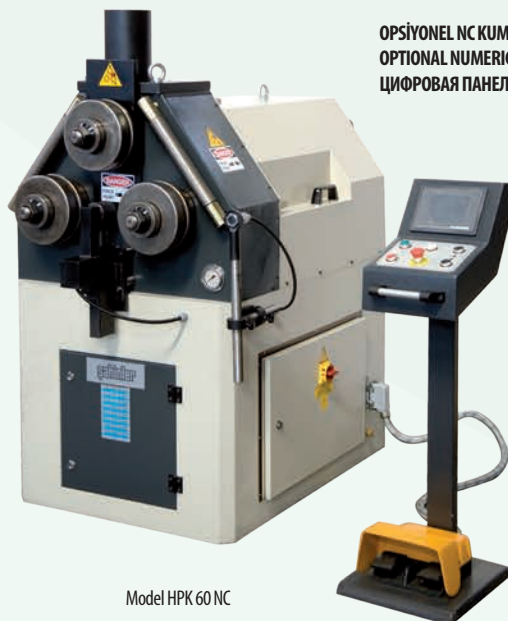
Model HPK 60 NC

OPSİYONEL NC KUMANDA PANELİ OPTIONAL NUMERIC CONTROL UNIT ЦИФРОВАЯ ПАНЕЛЬ УПРАВЛЕНИЯ NC (Опции)